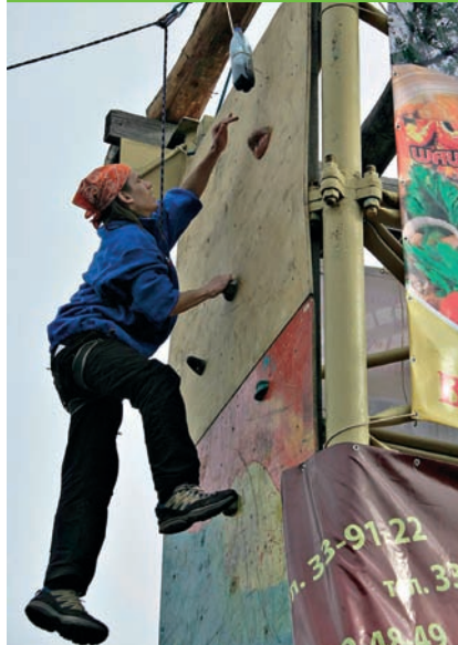
Просим не отрываться от коллектива