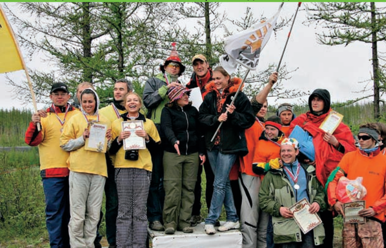
До нашей победы остался ровно один год...