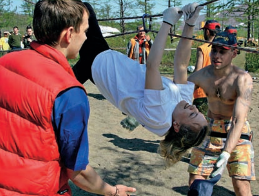
Ловкость рук и ног, и ничего более