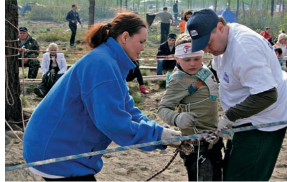
Противостояние: работа мысли и женской логики