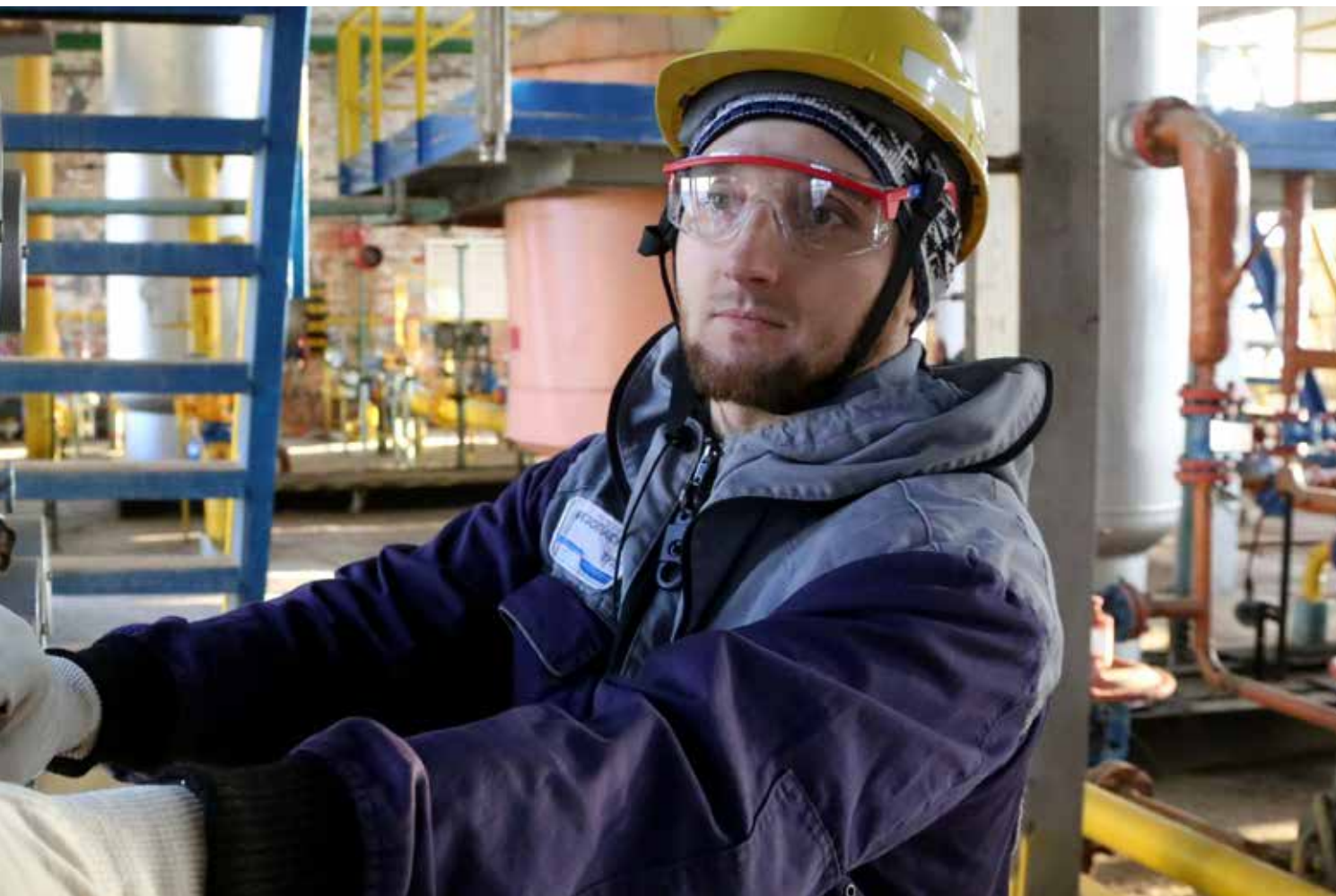
На обложке: Надежное газоснабжение.