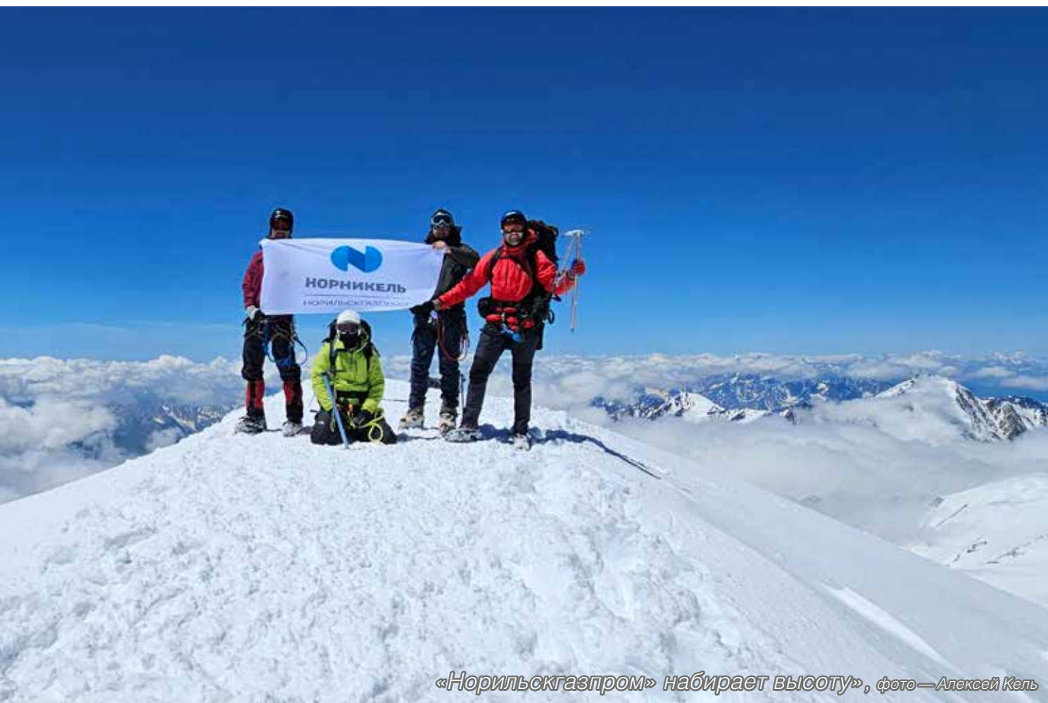
«Норильскгазпром» набирает высоту»